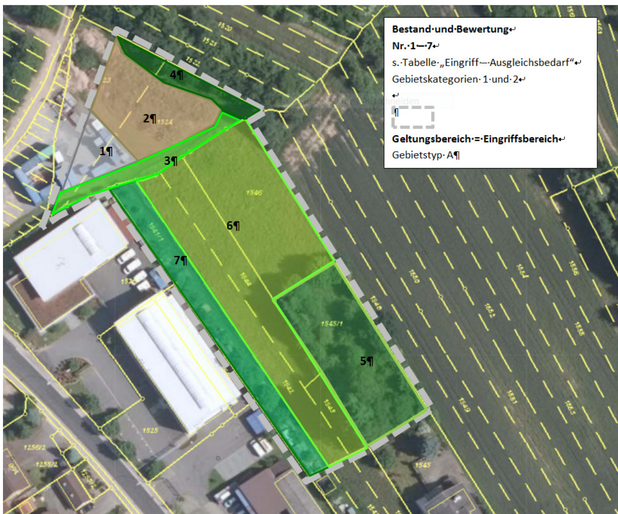
Lageplan: Bestand / Bewertung – Eingriffsregelung – M. = 1.000